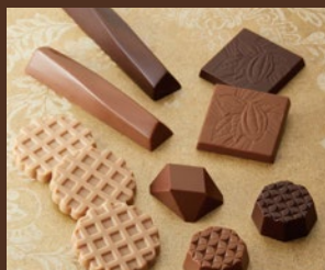
エレナリーゼ15 (税込) 930円