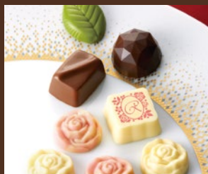
ロゼデュマタンC (税込) 760円

駒込のチョコレートメーカー、芥川製菓のポップアップストアがサンシャインシティにて1/31(金)・2/1(土)の2日間、期間限定でオープンします。バレンタインギフトや定番商品など、様々なチョコレートを幅広く取りそろえました。芥川製菓が手掛ける多彩なチョコレートの世界をご紹介します。