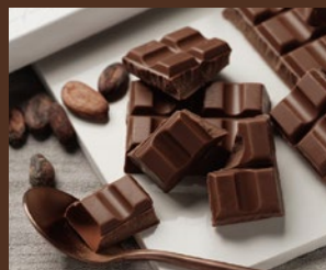
スペシャルミルクチョコレート (税込) 1,500円

開催日時: 1/31(金) 10:00~17:00 2/1(土) 10:00~16:00