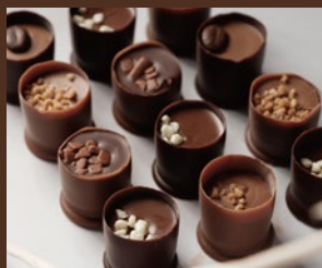
ベルギーカップスタイル20 (税込) 2,300円